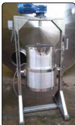
Tacho para Requeijão