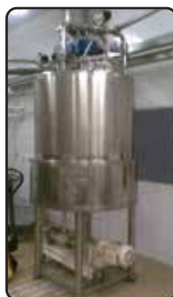
Planta de Processo de Amido