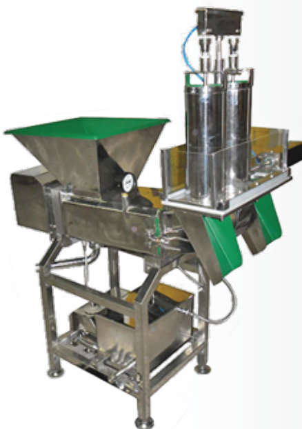
Moldadeira Pneumática 500 Kg