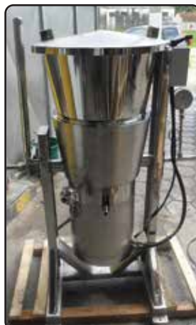
Liquidificador Industrial Camisa de Vapor