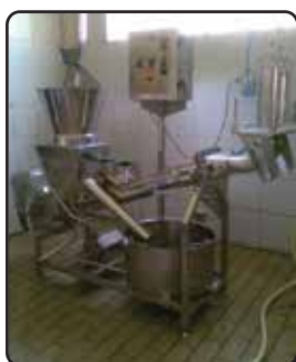
Monobloco 300 Kg/h