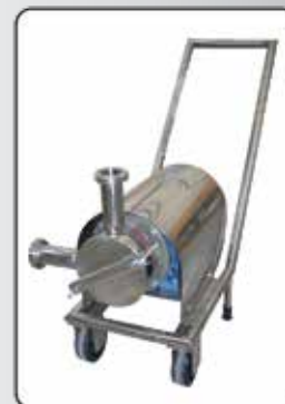
Bomba de Sucção