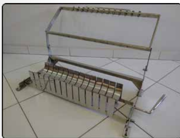
Fracionadeira Manual de Frescal e Ricota