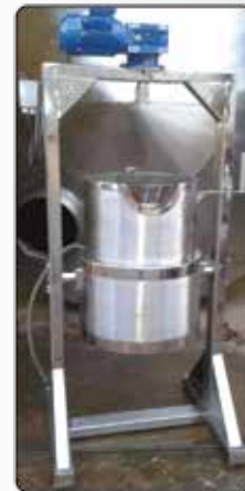
Tacho Fundo Reto