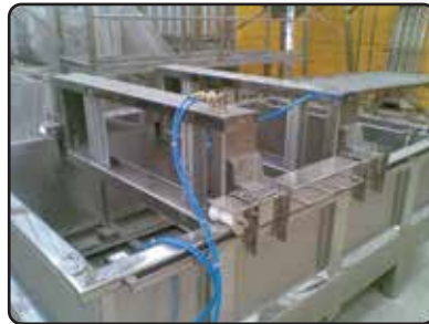
Drenoprensa Camisa Dupla