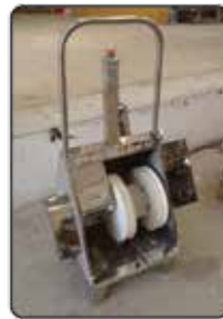
Lava Botas 1 Escova