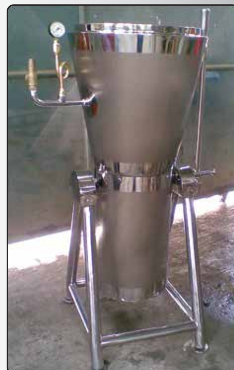
Liquidificador Industrial Half Piper