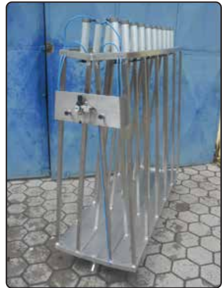
Prensa Pneumática Multifuncional