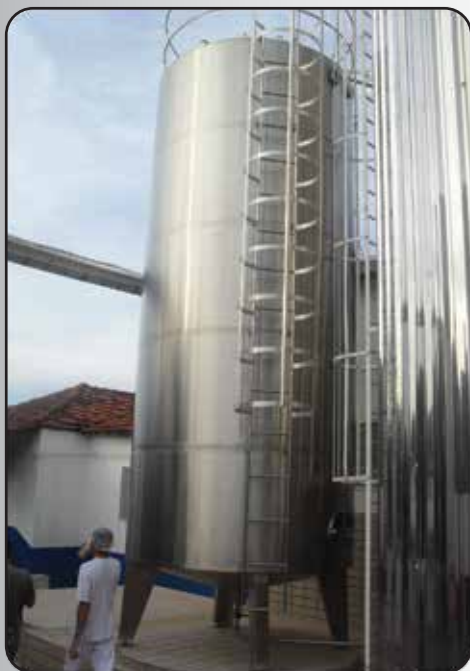
Tanque de Estocagem Vertical