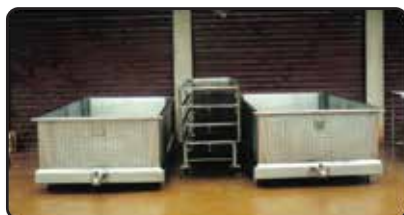
Tanque Camisa Baixa