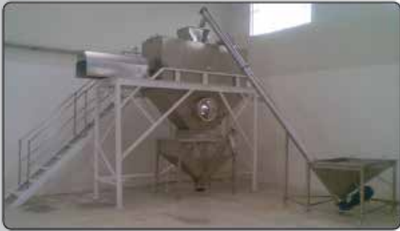
Misturador Ribbon Blender