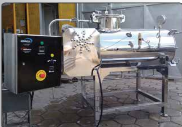
Máquina de Fundir Requeijão