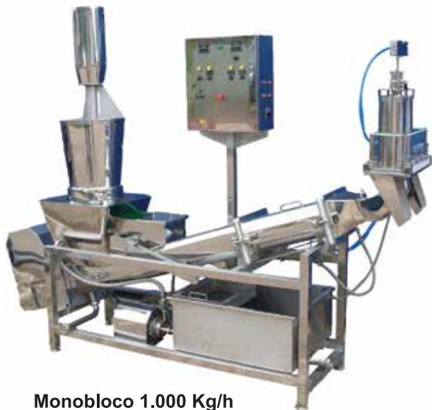
Monobloco 1.000 Kg/h