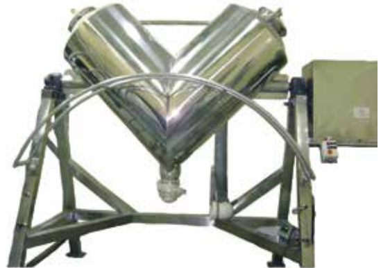
Misturador em V