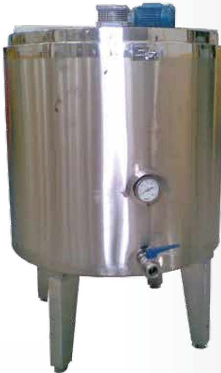
Fermentadora Maturadora - Imersão