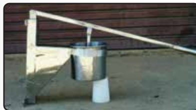
Prensador Manual de Bolinha