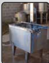
Tanque de Encolhimento Simples