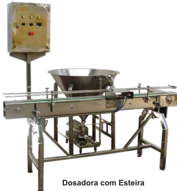
Dosadora com Esteira