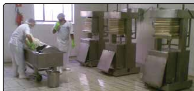
Prensa Hidráulica para Massa