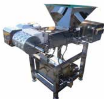
Moldadeira de Bolinha