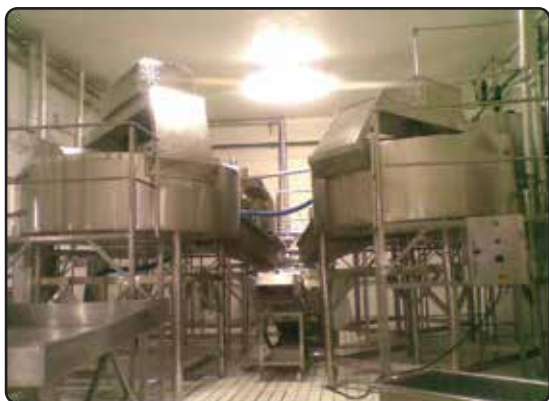
Planta Processo de Massa Requeijão