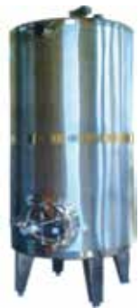
Tanques para Microcervejaria