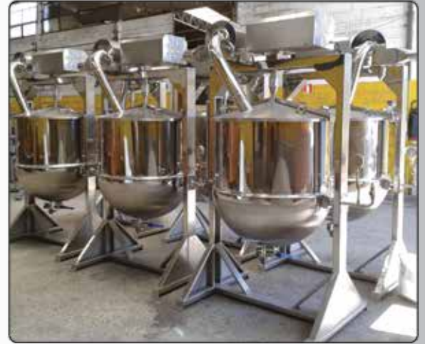
Tacho Semi Esférico