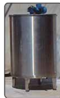
Tanque Pulmão Tampa Bi-Partida