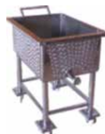
Carrinho de Transporte