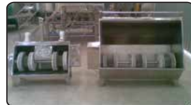
Lava Botas 2 e 3 Escovas