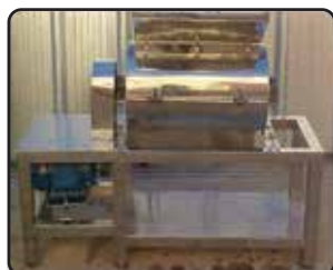
Ralador de Massa