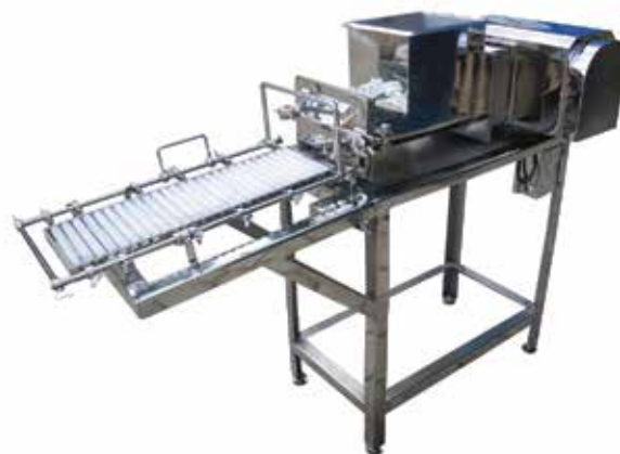
Moldadeira de Tablete