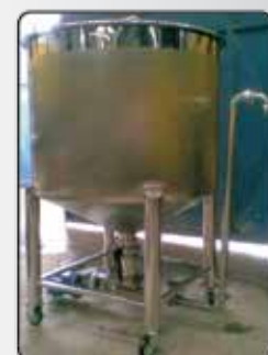
Dosadora Bomba Positiva