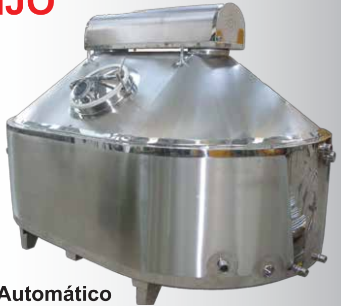
Tanque Automático Para Fabricação de Queijo