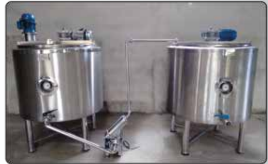
Fermentadora Maturadora - Imersão com Isolamento