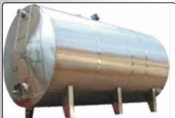
Tanque de Estocagem Horizontal