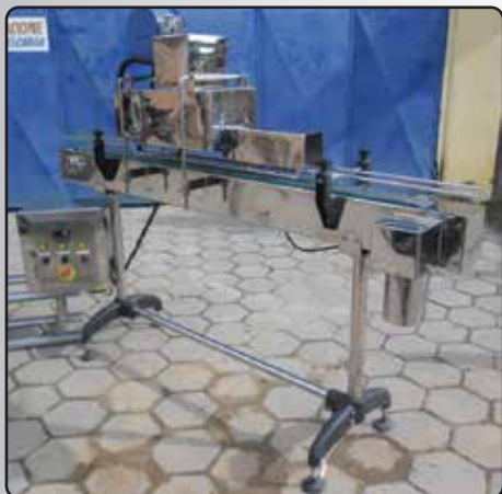
Túnel de Encolhimento para Rótulos