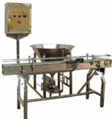
Dosadora com Esteira