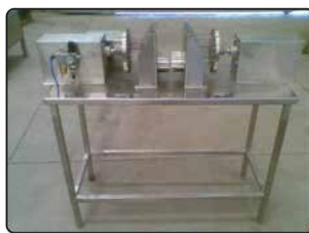
Máquina de Furar Queijo Gorgonzola