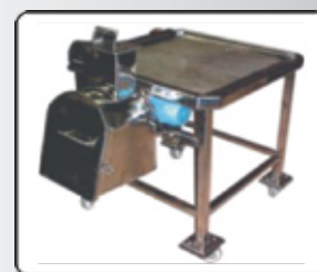
Picadeira de Massa