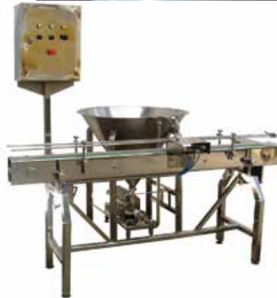
Dosadora Bomba Positiva com Esteira