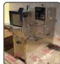
Túnel de Encolhimento