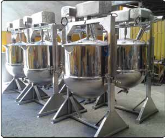
Tacho Semi Esférico