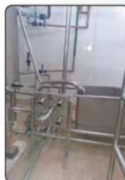
Painel de Distribuição