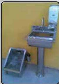
Pia e Lava Botas Simples