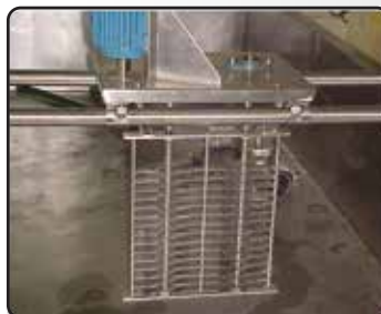
Picador de Massa Requeijão