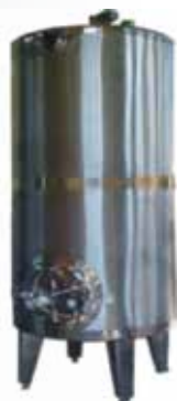
Tanque de Estocagem Vertical