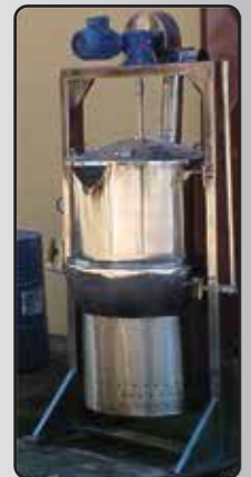
Tacho á Gás com Camisa