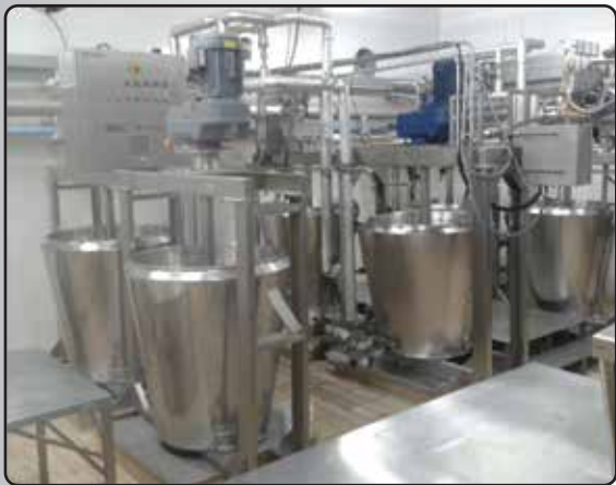
Tachos para Fabricação de Requeijão