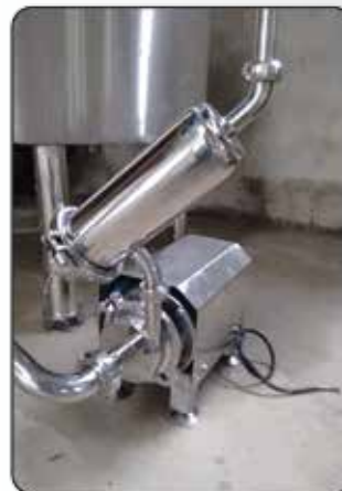
Bomba com Filtro de Linha