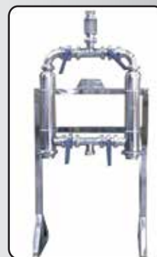
Filtro de Linha Duplo