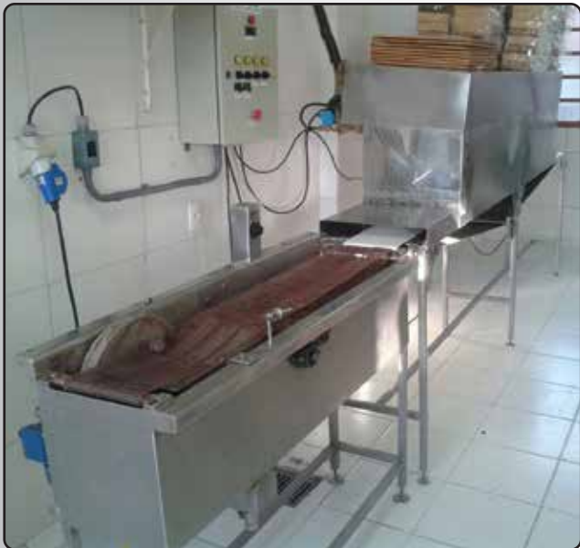
Cobrideira e Túnel de Secagem