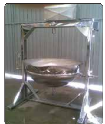
Tacho para Requeijão do Norte