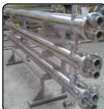
Trocador de Calor Tubular