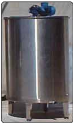
Tanque Batedor Tampa Bi-Partida