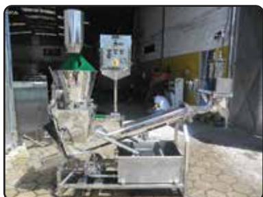
Monobloco 500 Kg/h