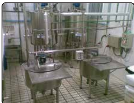
Planta de Processo de Creme