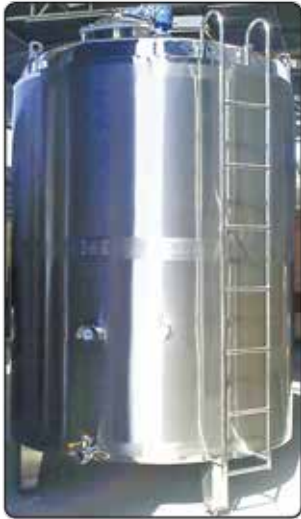
Fermentadora Half Piper