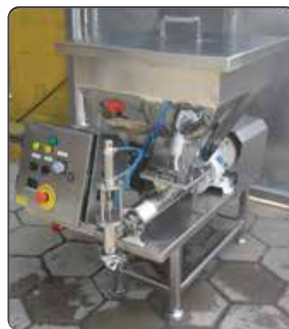
Dosadoras com Bomba Positiva