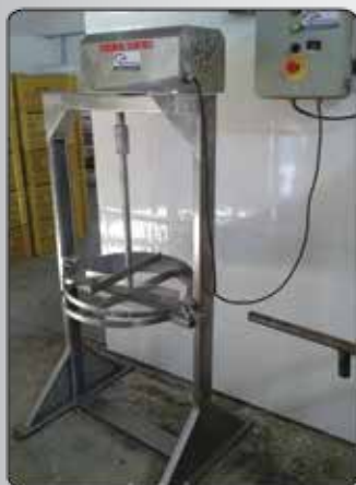
Batedor de Doce