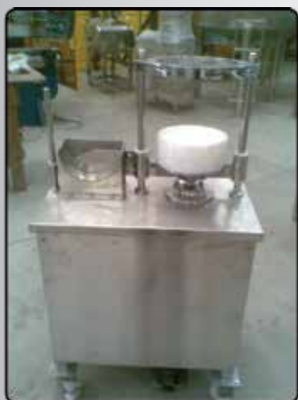
Fracionadeira de Queijos