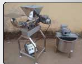
Moldadeira e Filadeira Pequena