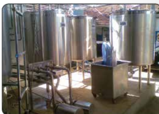
CIP com Painel