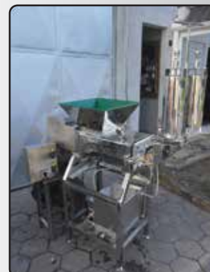
Moldadeira 300 Kg/h