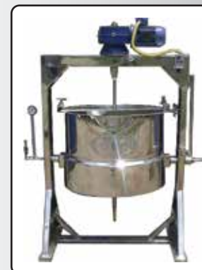
Filadeira com Camisa de Vapor