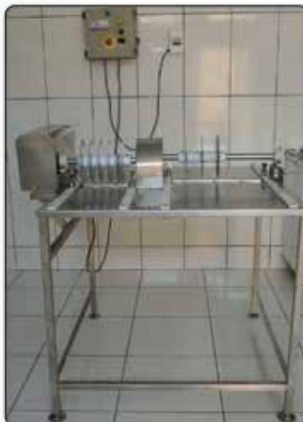
Mesa de Corte