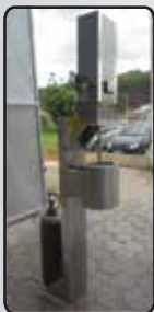
Prensador Pneumático Para Massa de Mussarela