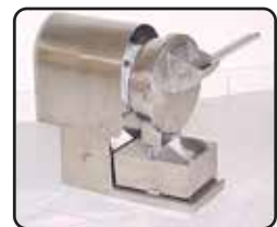
Ralador de Queijo