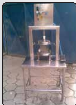
Máquina de Furar Queijo Gorgonzola