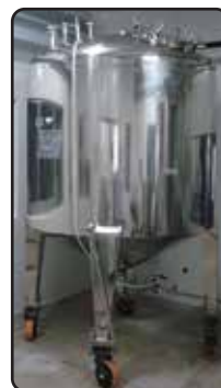
Tanque Pulmão Tampa Escotilha