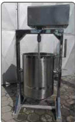
Tacho Simples á Gás